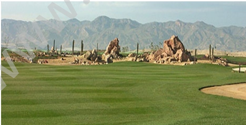
Céspedes en climas calidos

Cuando las temperaturas descienden por debajo de los 0°, -2°C, estas especies entran en letargo, marchitándose su parte aérea. Este letargo es total en las zonas de clima continental y de montaña. En las zonas costeras mediterráneas y meridionales, el letargo puede llegar a afectar al 30-50% de la vegetación con pérdida de color y pardeamiento general del césped. En primavera, con el ascenso de las temperaturas, las plantas vuelven a rebrotar de sus raíces. Fisiológicamente se caracterizan por ser plantas C4 en su metabolismo del CO 2 , por contraposición a las especies de clima templado antes estudiadas y que siguen un metabolismo C3. Esta diferencia fisiológica fundamental supone que las especies de climas cálidos sean energéticamente mucho más eficientes y por lo tanto consigan un mejor aprovechamiento de altas intensidades luminosas.