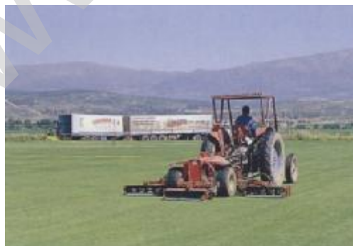
Segadora helicoidal arrastrada de 5 cuerpos